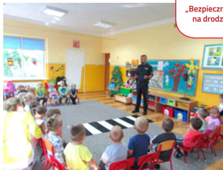
„Bezpiecznie na drodze”