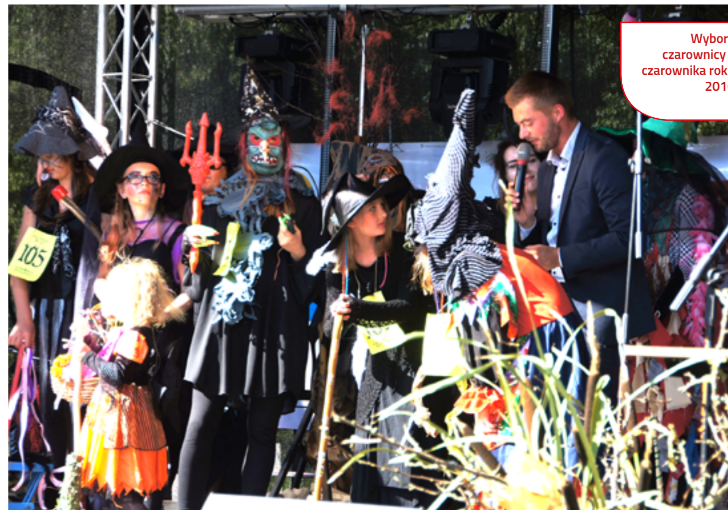
Wybory czarownicy / czarownika roku 2016