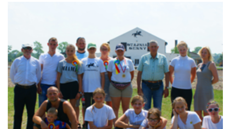
Członkowie Klubu podczas zakończenia roku szkoleniowego