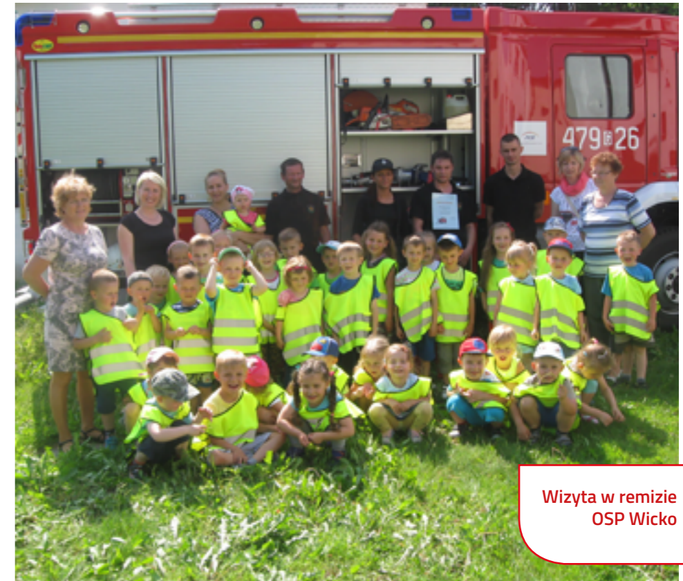
Wizyta w remizie OSP Wicko

W czasie wakacji wzięliśmy udział w barwnej paradzie podczas Dni Gminy Wicko przebrani w różnokolorowe, fantazyjne i bajkowe stroje. Miło było nam się spotkać. Nowy rok szkolny 2016/2017 przedszkolaki rozpoczęły w Zespole Szkół w Wicku, do którego zostaliśmy przeniesieni na czas rozbudowy naszej placówki. Jest nam tu dobrze, miło i przytulnie, jednak nie możemy doczekać się powrotu do naszego, nowego przedszkola.