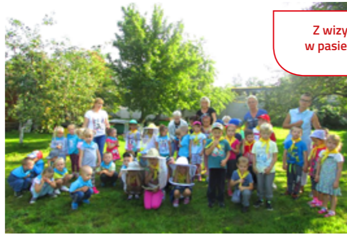
Z wizytą w pasiece