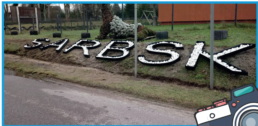
Sarbsk - skarpa oraz wiatcz - Fundusz Sołecki