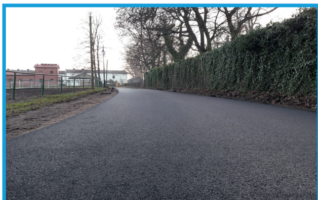
Nowa nawierzchnia asfaltowa w Nowęcinnie, ul. Św. Huberta