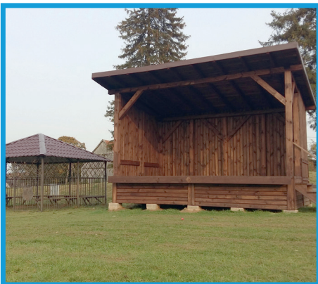
Budowa sceny i wiaty w Białogardzie - Fundusz Sołecki