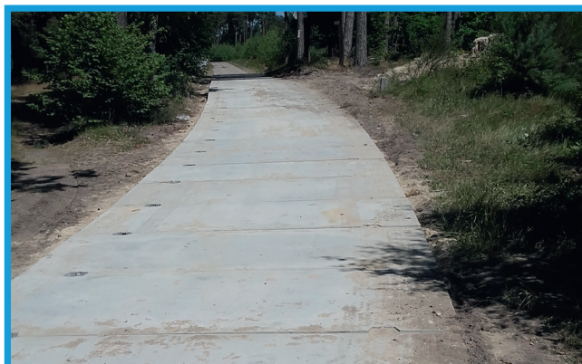
Nowa nawierzchnia z płyt drogowych w Dymnicy