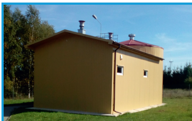
Stacja uzdatniania wody w Charbrowie