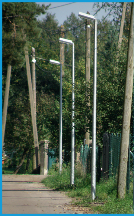
Oświetlenie w Żarnowskiej, ul. Polna