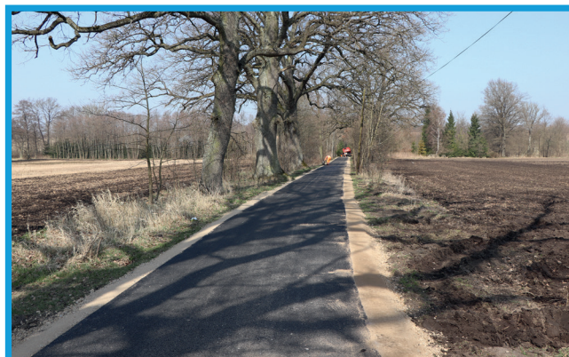
Nowa nawierzchnia asfaltowa we Wrześcienku