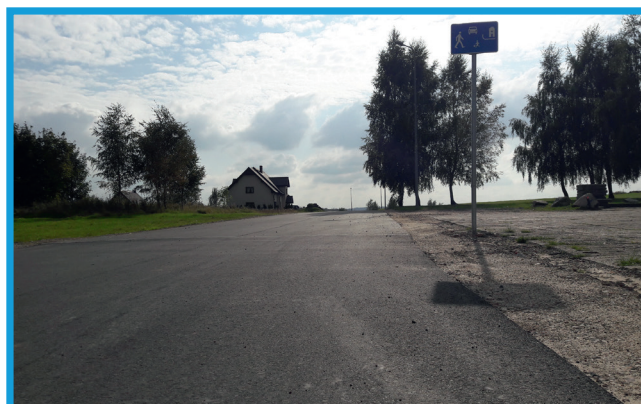
Nowa nawierzchnia bitumiczna w Charbrowie, ul. Lipowa