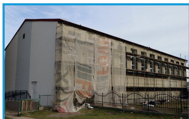
Termomodernizacja Szkoły podstawowej w Wicku