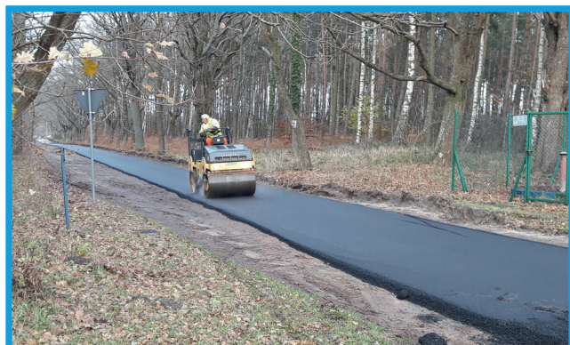
Nowa nawierzchnia asfaltowa w Dychlinie.