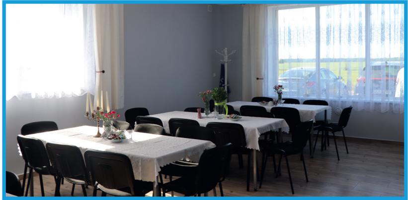
Remont świetlicy w Wojciechowie