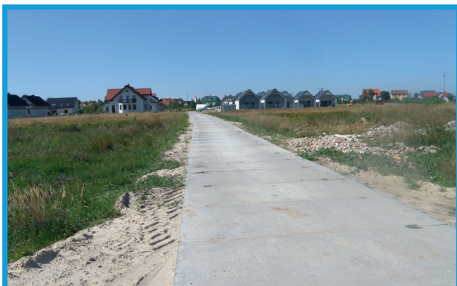
Remont drogi w Nowęcinnie, ul. Akacjowa