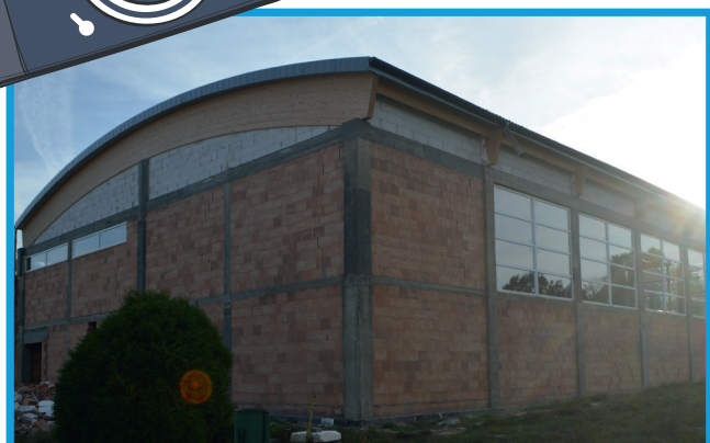
Rozbudowa Szkoły Podstawowej w Szenurzy