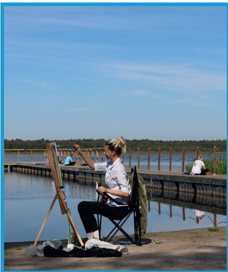
Pomost pływający w Nowęcinie - współfinansowany ze środków Funduszu Sołeckiego