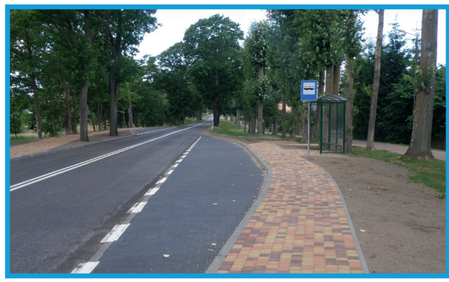
Budowa zatoki autobusowej wraz z wiatą w Charbrowie - ul. Łebska