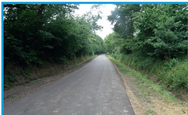
Nowa nawierzchnia asfaltowa w Gęsi