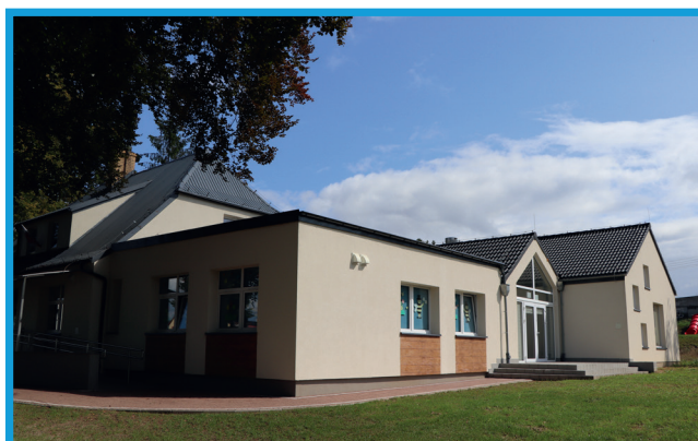
Przedszkole w Wicku