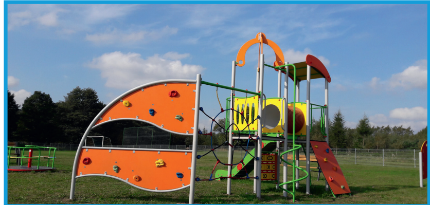
Plac zabaw w Krakulicach - Fundusz Sołecki