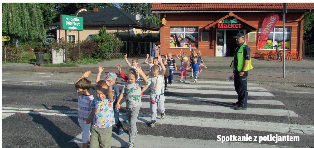
Spotkanie z policjantem